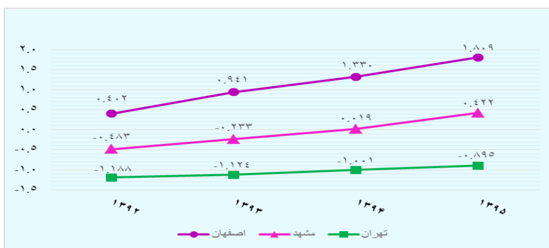
نمودار ۳- روند شاخص حمایت از فرهنگ در سه کلان‌شهر مطالعه‌شده

کلان‌شهرهای بررسی‌شده، اصفهان در بهترین وضعیت قرار گرفته و سیر صعودی نسبتاً تندی داشته است؛ به طوری که از ۰/۴۰۲ در ابتدای دوره به مقدار ۱/۸۰۹ در انتهای دوره رسیده و از ابتدا مقادیر مثبت داشته است.