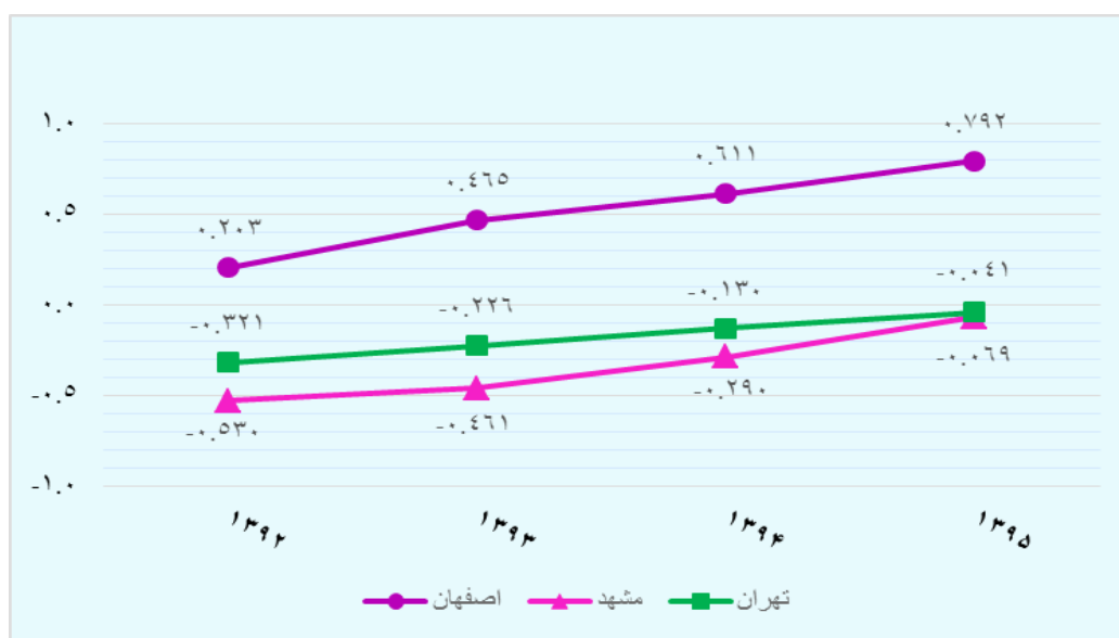
نمودار ۴- روند معیار زیست‌پذیری فرهنگی در سه کلان‌شهر مطالعه‌شده

مشهد آخرین کلان‌شهر از لحاظ بهره‌مندی شاخص زیست‌پذیری فرهنگی است و در طی دوره پژوهش مقادیر منفی داشته است. مشهد در این شاخص از ۰/۵۳۰- در ابتدای دوره به ۰/۰۶۹- در انتهای دوره رسیده است و با اینکه در مقایسه با تهران رتبه پایین‌تری دارد، رشد بهتری داشته و در انتهای دوره تقریباً دو کلان‌شهر مشهد و تهران، مقادیر نزدیک به هم و نزدیک به صفر داشته‌اند.