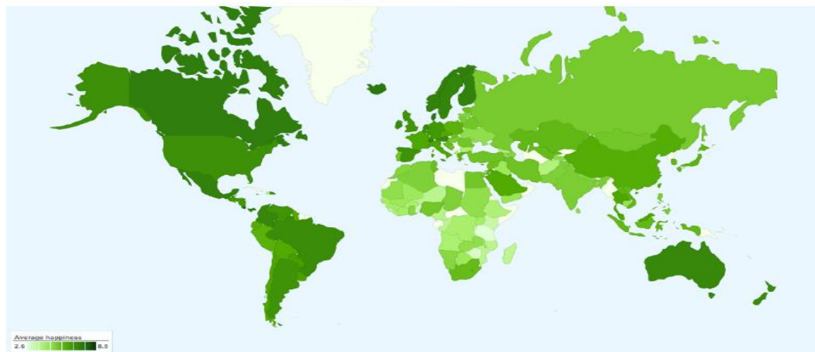
شکل ۱- پراکنش گرافیکی وضعیت شادمانی در جهان

How much people enjoy their life-as-a-whole on scale 0 to 10