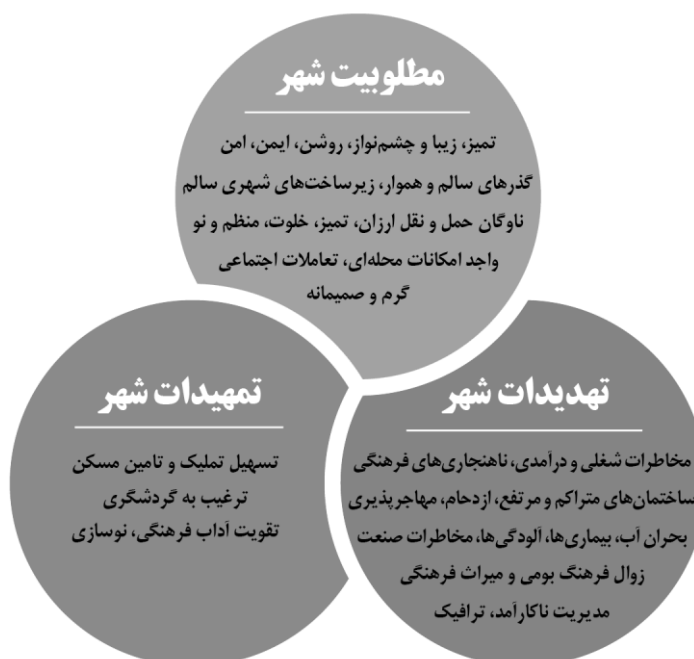
شکل ۳- شبکه مضامین کیفیت زندگی شهری در اصفهان

همان‌گونه که ذکر شد، دغدغه‌های بیان‌شده درباره کیفیت زندگی شهری در اصفهان با استفاده از تکنیک تحلیل مضمون تحلیل شد و در نهایت مشخص شد که شهروندان شرکت‌کننده