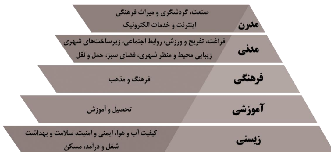
شکل ۲- هرم خوشه‌بندی اولویت‌های ابعاد کیفیت زندگی شهری